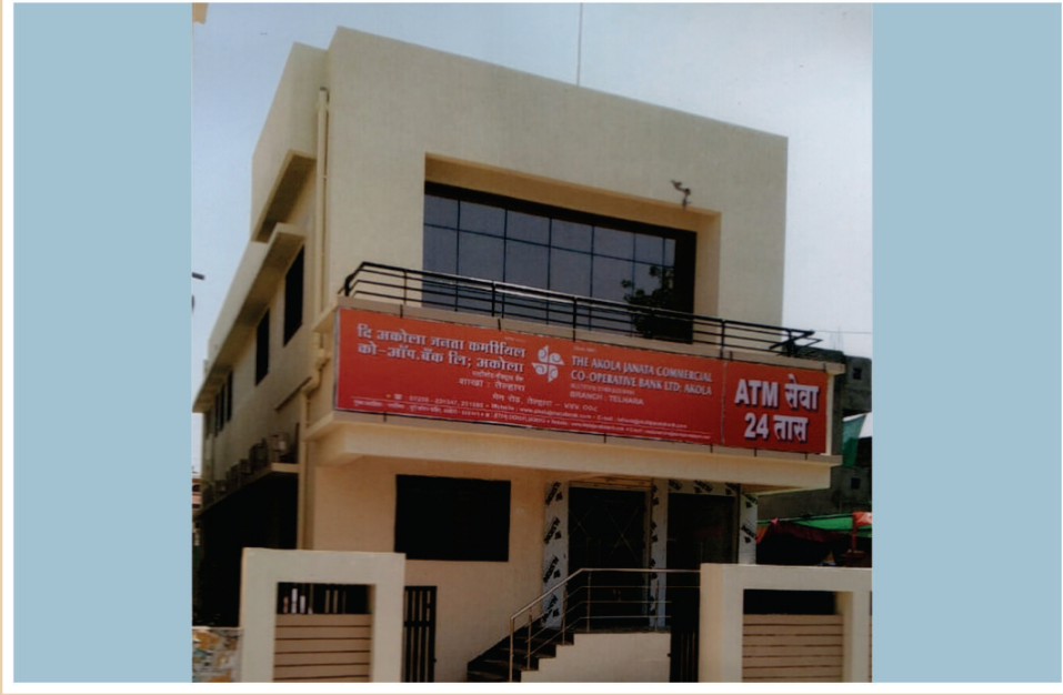
बँकेच्या तेल्हारा शाखा कार्यालयाची स्वमालकीची देखणी वास्तु